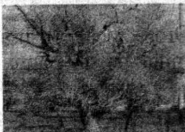
IL PROGETTO Rigenerazione dopo la xylella

di "valore" di territorio e delle opportunità collegate alla sua tutela, rigenerazione e valorizzazione, anche per finalità sociali ed economiche». La fase attuativa del progetto "Futura Caprarica" si articolerà in quattro workshop nell'ambito dei quali saranno attivati tavoli di discussione sugli specifici temi che scandiranno il percorso di partecipazione secondo la filosofia dello sviluppo bottom-up, perché sia innanzitutto la comunità locale