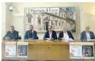
La presentazione del progetto a Palazzo Adorno