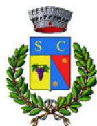
COMUNE DI SAN CESARIO