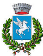
COMUNE DI CAVALLINO