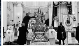
96 dpi SARCIO12.jpg 2048x1152 pixel