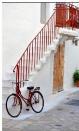
72 dpi ALECRIO1.jpg 1080x778 pixel