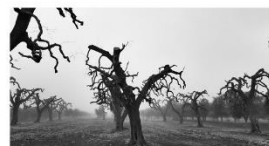
96 dpi LUCIA11.jpg 3867x1968 pixel