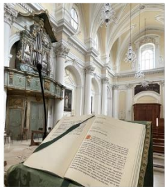
72 dpi CHICRI11.jpg 3000x3448 pixel