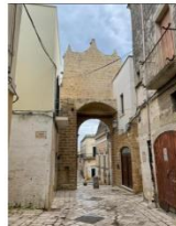
FRABUC1.jpg 295x365 pixel