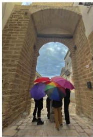
96 dpi ALECRI1.jpg 2753x4029 pixel