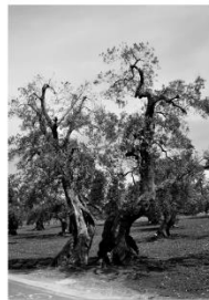
96 dpi ALECRIO3.jpg 1067x1575 pixel