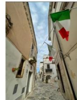
FRABUC2.jpg 295x365 pixel