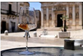
72 dpi ALECRU1.jpg 1080x723 pixel