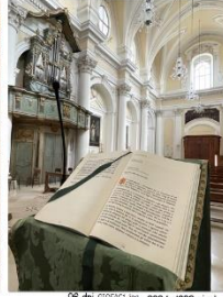
96 dpi GIOPAC1.jpg 3024x4032 pixel