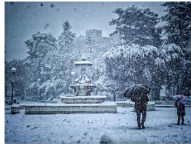
96 dpi SARCIO11.jpg 2000x1500 pixel