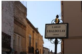
72 dpi CARRO11.jpg 6000x4000 pixel