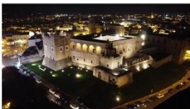
72 dpi SARCIO11.jpg 4000x2250 pixel