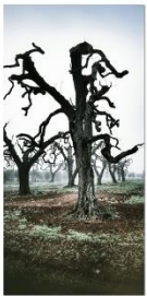
96 dpi LUCIA1.jpg 1960x4032 pixel