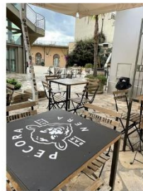
96 dpi ALBAC1.jpg 786x1024 pixel