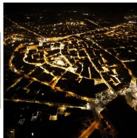
72 dpi SARCIO13.jpg 2553x2693 pixel