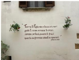
96 dpi GIBZAC1.jpg 1600x1200 pixel