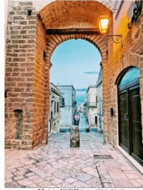
96 dpi SARCIO1.jpg 1536x2048 pixel