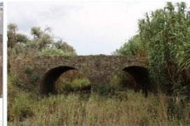
72 dpi CARRO13.jpg 6000x4000 pixel