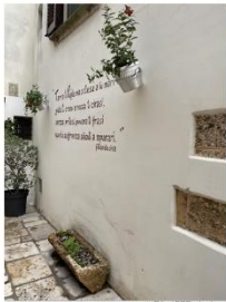
96 dpi ALISTE1.jpg 1170x1555 pixel