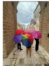
72 dpi SARCIO14.jpg 628x1109 pixel