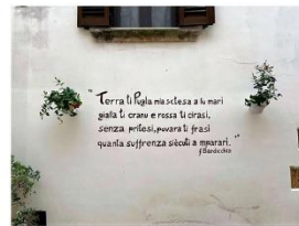
96 dpi ALECRIO1.jpg 1007x751 pixel