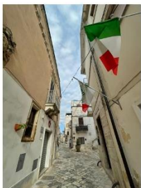
96 dpi CHITAC11.jpg 1200x1600 pixel