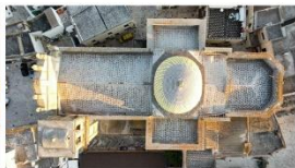
96 dpi SARCIO12.jpg 4000x2250 pixel