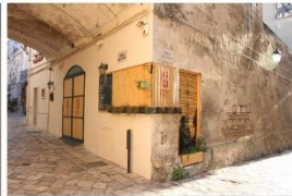
72 dpi CARRO12.jpg 6000x4000 pixel