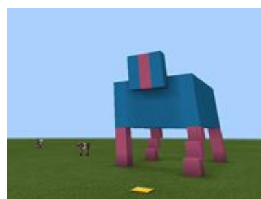
Riproduzione Squadra 3