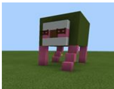
Riproduzione Squadra 2